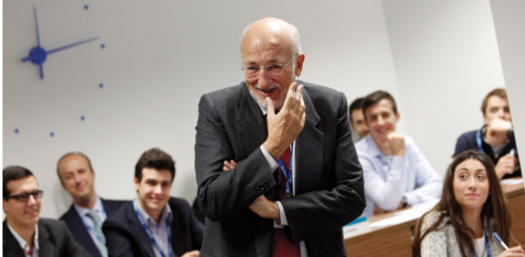
Juan Roig, presidente de Mercadona y vicepresidente de EDEM, impartiendo clase como profesor de la asignatura de Fundamentos de la Dirección de Empresas. Juan Roig, President of Mercadona and Vice-president of EDEM, giving a class in Foundations of business management in the BBA.