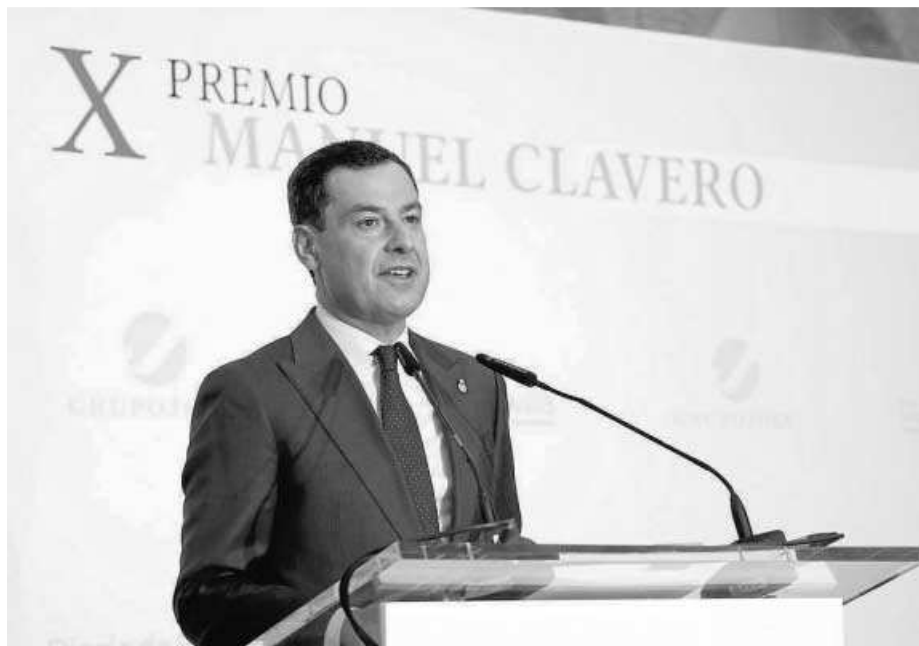
● El presidente de la Junta de Andalucía, Juanma Moreno.