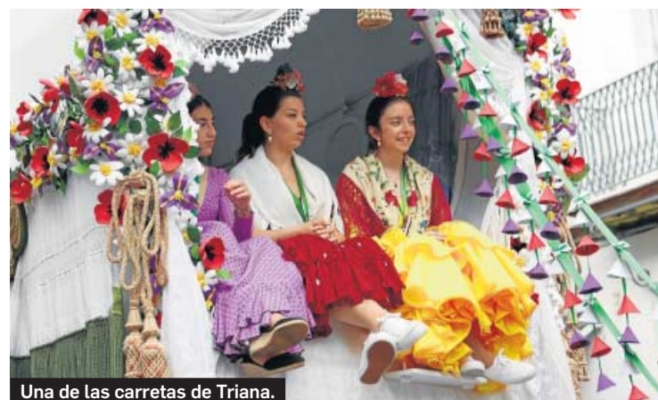
Una de las carretas de Triana.

20-21 EMPIEZAN LOS DÍAS GRANDES DE LA ROMERÍA DEL ROCÍO